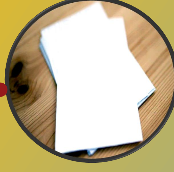
Kağıt M.S. 105